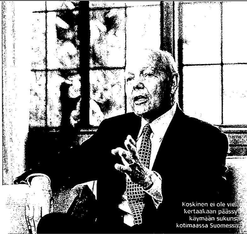
Koskinen ei ole vielä kertaakaan päässyt käymään sukunsa kotimaassa Suomessa.

AES:N JA AMERICAN CAPITAL LIMITEDIN hallituspaikkoja lukuun ottamatta Koskinen oli vielä haastatteluhetkellä jättä-